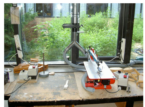
Afsugning fra lille deкупørsav